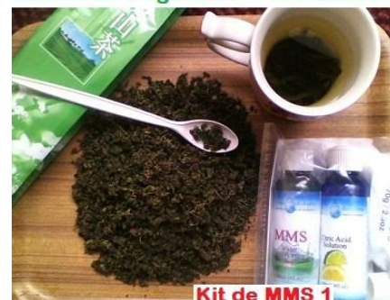
Sachet de Jiogoulane = 100 tasses

Pour une personne malade voulant guérir : 8 tasses par jour, soit 240 par mois, environ 2,5 sachets sont nécessaires par mois. Donc prévoir 10 sachets tous les 4 mois, soit 3 commandes par an, ce qui rend les choses plus facile.